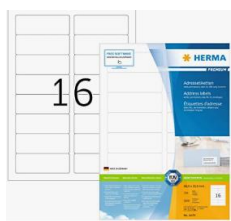
HERMA 4479 Adressaufkleber DIN A4 (88,9 x 33,8 mm, 100 Blatt, Papier, matt) selbstklebend, bedruckbar, permanent haftende Universal...